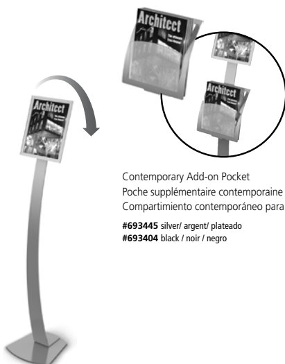
Contemporary Add-on Pocket Poche supplémentaire contemporaine Compartimiento contemporáneo para añadir

#693145 silver / argent / plateado #693104 black / noir / negro