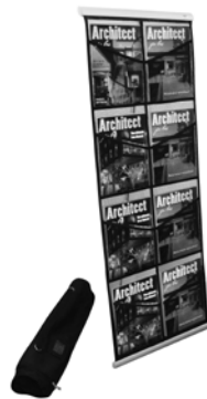
Mesh Floor Displays Présentoirs de sol en mailles Exhibidores de malla para piso

#780272 black / noir / negro 8 pocket / 8 poches / 8 compartiments #780172 black / noir / negro 4 pocket / 4 poches / 4 compartiments