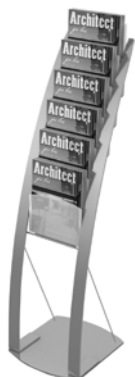
Contemporary Floor Displays Présentoirs de sol contemporains Exhibidores contemporáneos para piso

¡Revise estos otros exhibidores para piso de Deflecto!