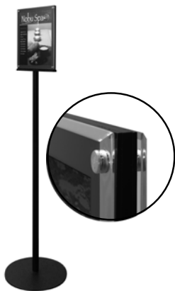
Double-sided Magnetic Sign Display Panneau d'affichage magnétique à double face Exhibidor magnético de doble lado de avisos

#693245 silver / argent / plateado #693204 black / noir / negro